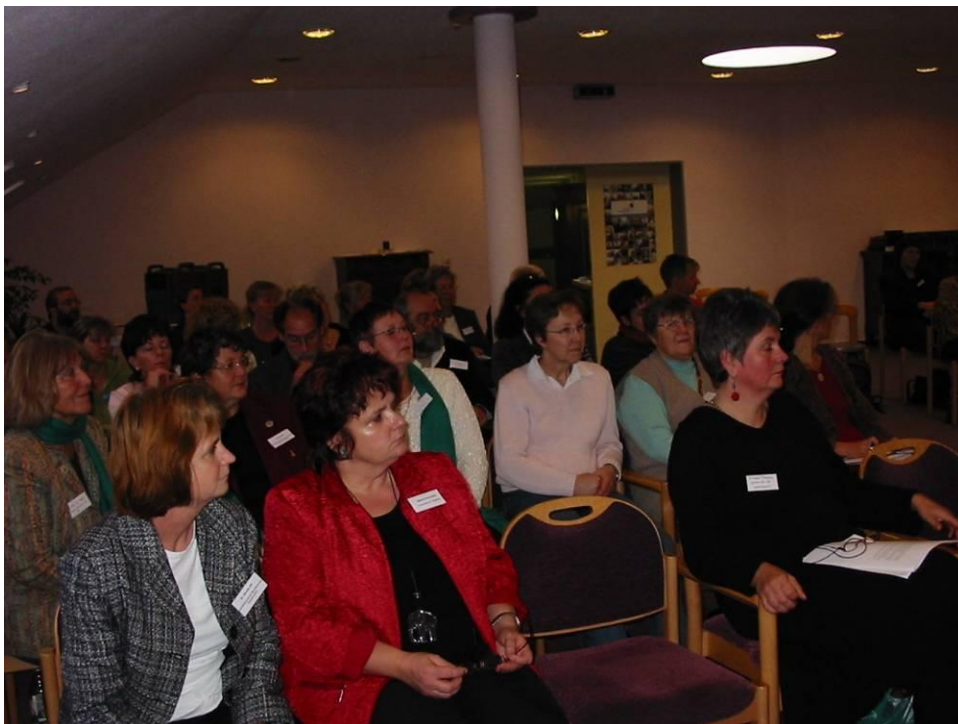
TeilnehmerInnen während der Vorträge

Eine gute Einstimmung auf das Thema bietet schon der Veranstaltungsort, das Augustenstift mit seiner offenen und gastfreundlichen Atmosphäre.