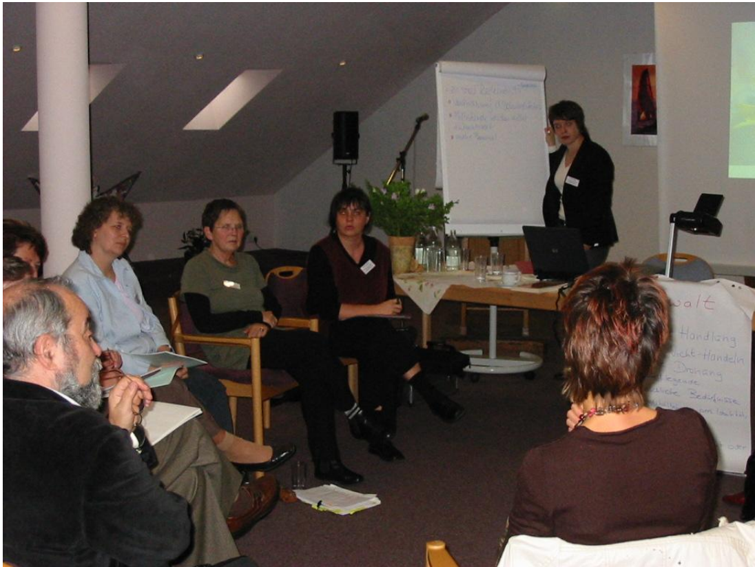
AG Pflege und Gewalt