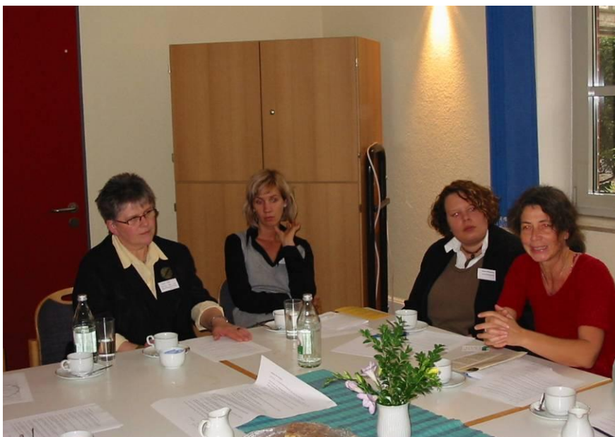
AG Frauenbild und Menschenwürde