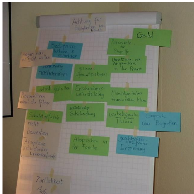
AG Frauenbild und Menschenwürde