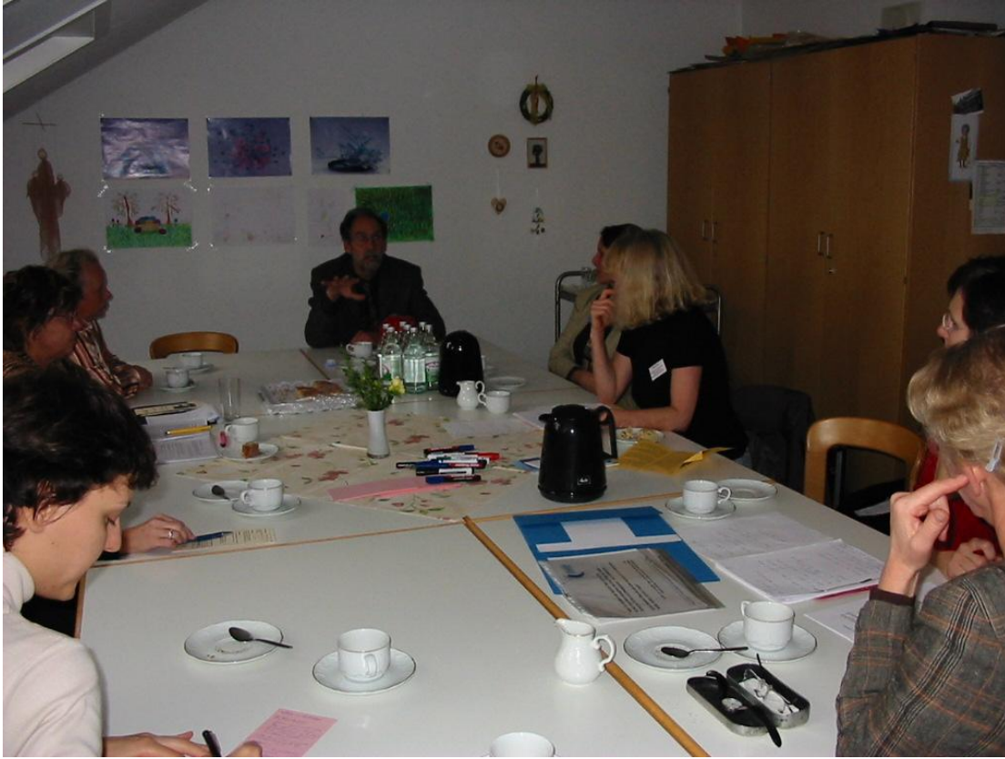
AG Vereinbarkeit von Pflege, Beruf und Familie