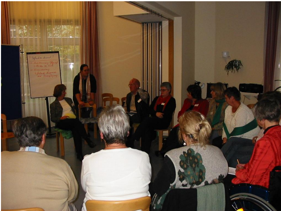
AG Pflege und Armut